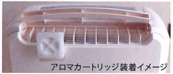
アロマカートリッジ装着イメージ

AEAJ認定のアロマセラピストによる特別に配合されたアロマをミスト状で拡散させることができます。また、精油の殺菌・抗菌作用により、室内の空気清浄にもなります。(AEAJ:公益社団法人日本アロマ環境協会)